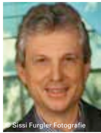
Sissi Furgler Fotografie